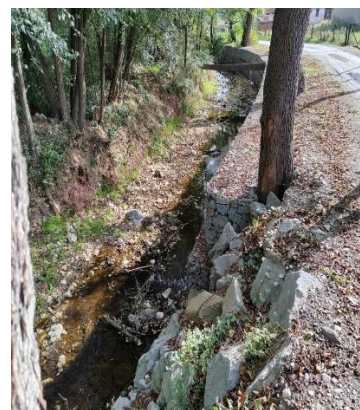
Врба, река Товарница (санација обалоутврде габионима)