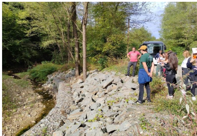
Драгосинци, река Товарница (санација обалоутврде габионима)